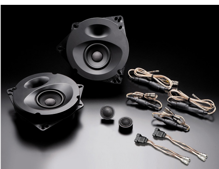
SP-S171E (純正6スピーカー装着車・フロント専用)