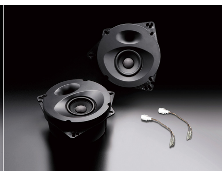
SP-S17E (純正4スピーカー装着車・フロント専用)