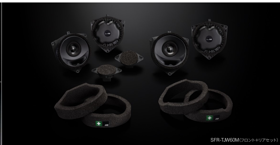
SFR-TJW60M(フロント+リアセット)