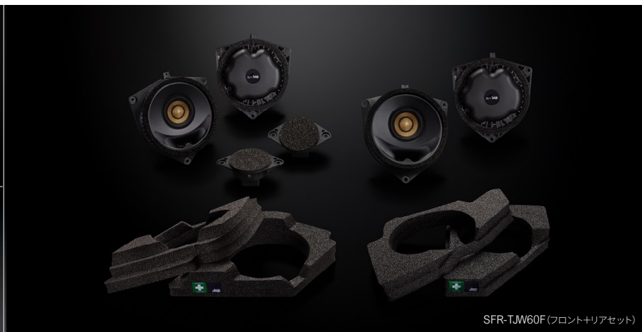
SFR-TJW60F(フロント+リアセット)