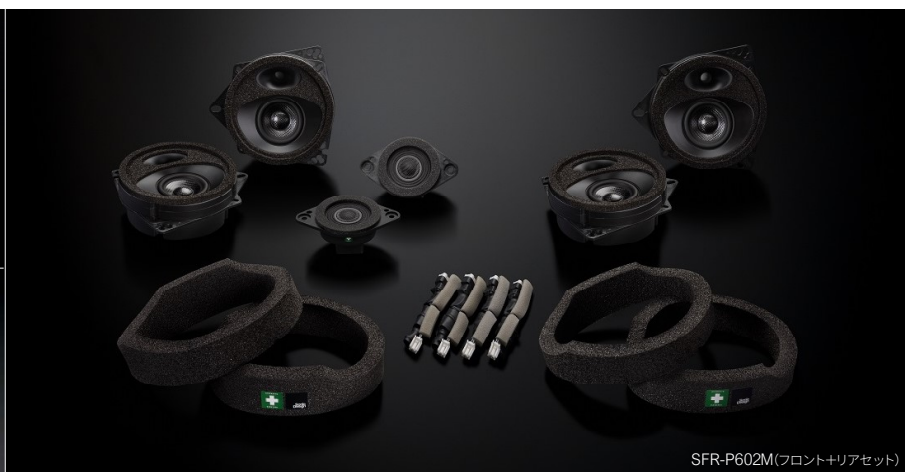
SFR-P602M(フロント+リアセット)