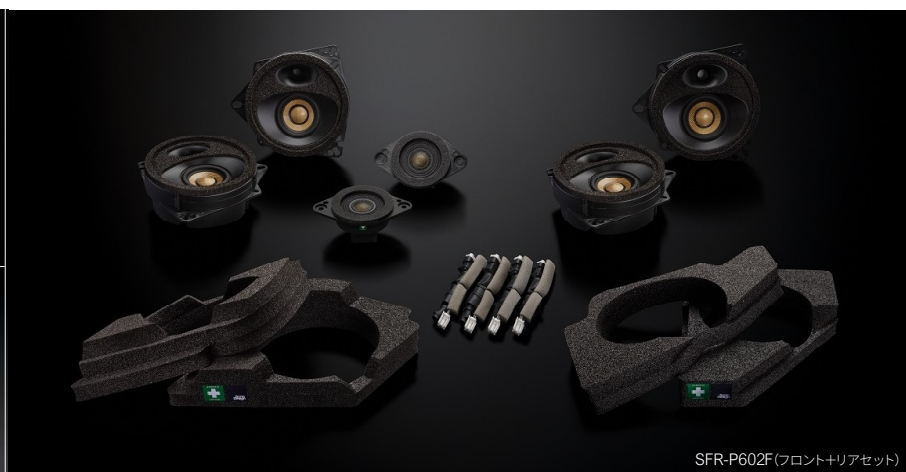
SFR-P602F (フロント+リアセット)