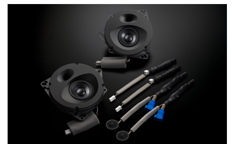
SF-ZN082M スピーカーパッケージ 108,900円(税抜価格99,000円) 取付費別 純正6スピーカー装着車・フロント専用 推奨取付時間:2H