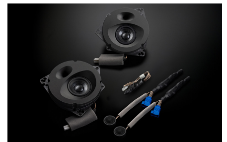
SF-ZN082M2 スピーカーパッケージ 116,600円(税抜価格106,000円) 取付費別 純正8スピーカー装着車・フロント専用 推奨取付時間:3H

●特殊樹脂製バックチャンバー 振動モードの異なる特殊樹脂製 バックチャンバーとアルミダイカス ト製パッフルとを強固に締結し、高 気密で不要共振を排除した理想の エンクロージャが完成。ユニット背 面を湿気や走行中の気圧変化から 守り、良い音を長くお楽しみいただ ける抜群の耐久性も実現しています。