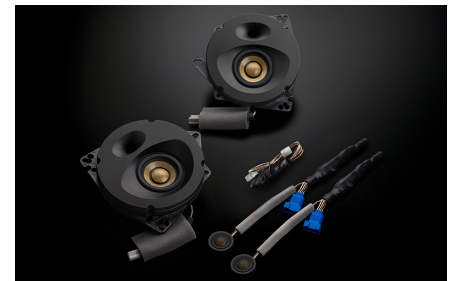
SF-ZN082F2 スピーカーパッケージ 207,900円 (税抜価格189,000円) 取付費別 純正8スピーカー装着車・フロント専用 推奨取付時間:3H

●特殊樹脂製バックチャンパー 振動モードの異なる特殊樹脂製バックチャンパーとアルミダイキャスト製パッフルとを強固に締結し、高気密で不要共振を排除した理想のエンクロージャが完成。ユニット背面を湿気や走行中の気圧変化から守り、良い音を長くお楽しみいただける抜群の耐久性も実現しています。