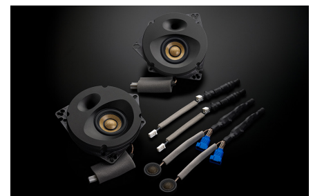
SF-ZN082F スピーカーパッケージ 200,200円 (税抜価格182,000円) 取付費別 純正6スピーカー装着車・フロント専用 推奨取付時間:2H