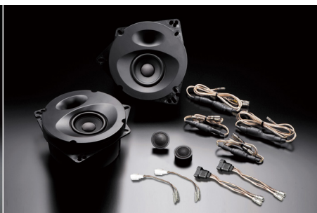
SP-862 (純正6スピーカー装着車・フロント専用)