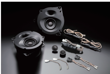
SP-868 (純正8スピーカー装着車・フロント専用)

【製品に関するご注意】●本製品は音質最優先設計のため、純正リアスピーカーと比較して能率(出力音圧レベル)がやや低めに設定されております。本製品を8スピーカー車または6スピーカー車に装着し、純正リアスピーカーと併用する場合は純正AVシステム側のフェーダーを使ってフロント/リアの音量バランスを再調整されることをお勧めします。●ソニックデザイン製品認定販売店では、SonicPLUSの高音質をさらに引き立てるグレードアッププランも各種用意しております。これらのプランはSonicPLUSを装着した後もご検討・ご注文いただくことができ、オーナーひとりひとりのご要望に沿った多彩なカスタマイズをお楽しみいただけます。詳しくはお近くのソニックデザイン製品認定販売店、または直接弊社へお問い合わせください。