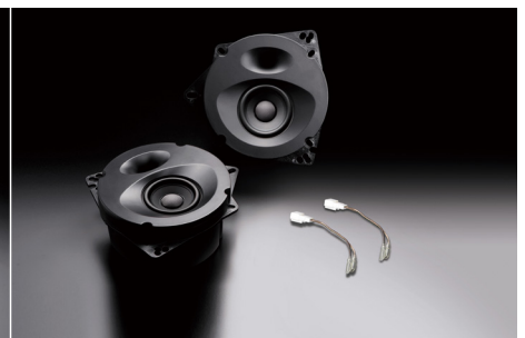
SP-861 (純正2スピーカー装着車専用)