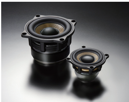
SD-N77R 型(左)とSD-N52R 型(右)

2C-P30L Double Crest スピーカーパッケージ 913,000円(税抜価格830,000円) 取付費別 受注生産品 ネットワークレス仕様