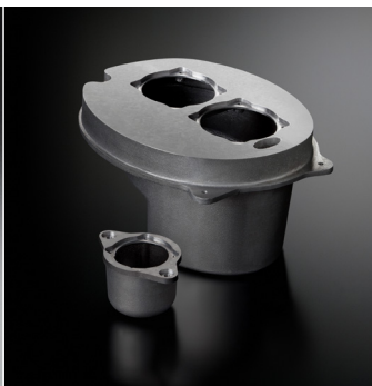
ソノキャスト ARMS エンクロージャ