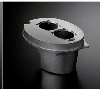
ソノキャスト ARMS エンクロージャ