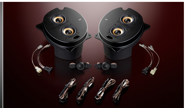
1C-P30 Single Crest (ネットワーク付属)