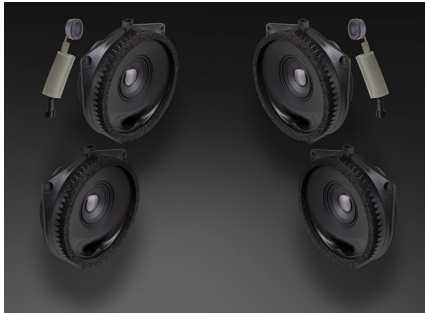
TFR-J10E スピーカーパッケージ 140,800円 税込価格 取付費別 フロント+リア 推奨取付時間:2.0H