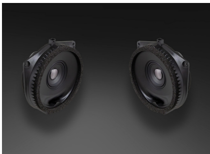
TR-J10E スピーカーパッケージ 63,800円 税込価格 取付費別 リア専用 推奨取付時間:0.75H