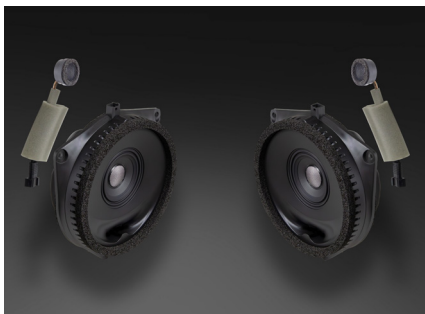
TF-J10E スピーカーパッケージ 77,000円 税込価格 取付費別 フロント専用 推奨取付時間:1.5H