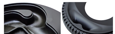
「Gチューナー」バッフル内面フレア部 「Gチューナー」バッフルフレア部

これまでの一般的なカースピーカーでは再現が難しかった正確で切れ味の良い低音再生を実現するため、SonicPLUSではエンクロージャ方式のメリットを最大限に引き出すパフレポート方式をさらに深化させた独創の「Gチューナー」を採用。超低域再生化やワイドレンジドライバーの制御などパフレポート部の最適化により、可聴帯域ほとんど(33Hz~20000Hz)の高音質再生を1つのモジュールで実現しました。あわせてクロスオーバーなどのフィルター等が不要になることで音声信号経路の究極的なダイレクト化が可能。SonicPLUSが目指したのは、大音量でなくても音楽の満足感が得られる緻密でバランスの取れた音づくり。「量より質」にこだわった自然な低音をお楽しみください。