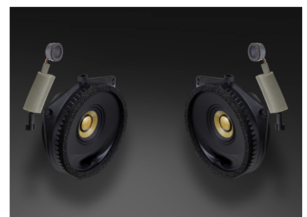
TF-J10F スピーカーパッケージ 277,200円 税込価格 取付費別 フロント専用 推奨取付時間:1.5H