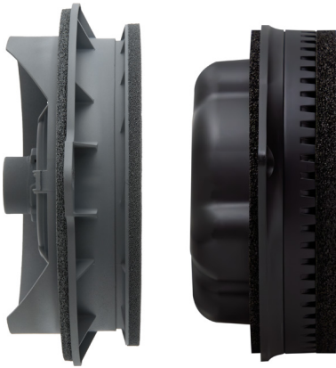
ユニット背面が開放されエンクロージャ機能のない一般的な純正16cmスピーカー(概念説明用モデル)と専用開発の高性能ユニットとエンクロージャを一体化したSonicPLUSスピーカーモジュール

一般的なドアスピーカーはユニットの背面が開放され、ユニット前面とほぼ同じ大きさの音がドアパネルの裏側にも放出されています。この方式はドア内部をエンクロージャ(キャビネット)として有効利用でき、構造も簡単なことから、ほとんどの純正ドアスピーカーが採用しています。