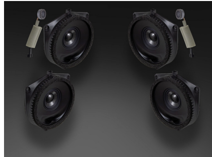
TFR-J10M スピーカーパッケージ 255,200円 税込価格 取付費別 フロント+リア 推奨取付時間:2.0H