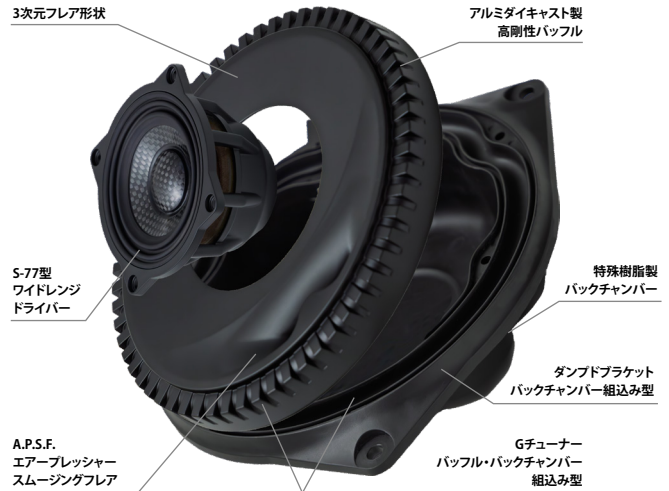
※イメージ図。バックチャンバー内部は実際の製品とは異なります。

SonicPLUSには、一般的な16cm口径スピーカーと比べて直径で1/2、振動板面積で1/4にも満たないマイクロサイズの77mm小型高性能ドライバーを投入。純正スピーカーの装着スペースにエンクロージャとスピーカーユニットを一体化し収めています。搭載されるワイドレンジドライバーには、駆動系の動作精度を向上させてボイスコイルギャップを限界まで狭めたナローギャップ・モーターシステムをはじめ、厳選された高能力ネオジウムマグネットによる強力な磁気回路や高剛性アルミモノブロックフレーム、A.P.S.E.(エアプレッシャー・スミングエッジ)、理想の音響特性を追求した振動板素材など、ソニックデザイン独自のマイクロスピーカー・テクノロジーを結集。小口径スピーカーならではの切れ味とレスポンス、大口径スピーカーに匹敵するエネルギー感と再生能力を妥協なく両立しています。