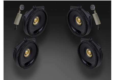
TFR-J10F スピーカーパッケージ 541,200円 税込価格 取付費別 フロント+リア 推奨取付時間:2.0H