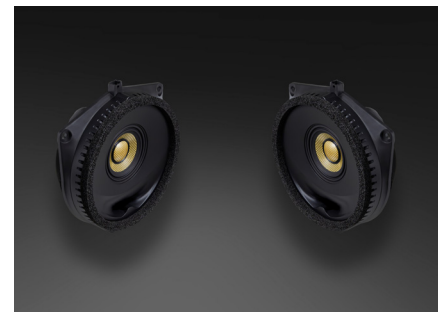
TR-J10F スピーカーパッケージ 264,000円 税込価格 取付費別 リア専用 推奨取付時間:0.75H