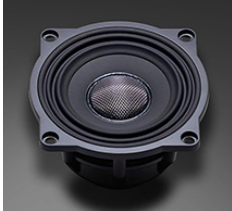
スタンダードモデル

クラスを超えた、正確で情報量豊かな再生音を実現。DMF振動板とナローギャップ・モーターシステム採用77mmワイドレンジドライバー。日常のドライブに自然で快適な音楽を加えるモデルです。聴き疲れしないクリアなサウンドで手軽に車内空間を豊かにします。独自のマイクロスピーカー・テクノロジーにより、小口径ならではの音の切れ味と小口径の限界を打ち破るワイドレンジ再生とを両立した77mmウーファーユニット＝「S-77E」型を採用。上級機種同様に新世代のDMF(ディファインド・マイクロファイバー)振動板と、駆動系の動作精度を向上させてボイスコイルギャップを狭めたナローギャップ・モーターシステム、A.P.S.E.(エアプレッシャー・スムージングエッジ)を投入し、クラスを超えた正確で情報量豊かな再生音を実現しています。