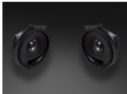
TR-J10M スピーカーパッケージ 121,000円 税込価格 取付費別 リア専用 推奨取付時間:0.75H