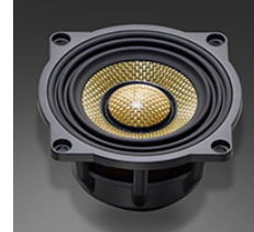
トップグレードモデル

ハイエンドスピーカー直系「HAC」(ハイブリッド・アラミド・カーボン)振動板とオールピュアアラミドセンター振動板を採用。緻密でスケール感あふれる再生音の77mmフルレンジユニット音源の持つ本来の魅力を余すことなく引き出し、精緻で洗練された音を楽しめる最上級モデルです。音の質感や表現力が際立ち、不要な音が排除された純粋な音の空間を車内全体に生み出します。新開発の77mmワイドレンジドライバー「S-77F」型を搭載。最上級プレミアムラインと同じ「HAC」(ハイブリッド・アラミド・カーボン)振動板をコーン部に、オールピュアアラミドのセンターキャップを贅沢に使用し、A.P.S.E.(エアプレッシャー・スムージングエッジ)技術を採用しました。これにより、最適な音質チューニングが施され、低歪率とフラットな周波数レスポンスを低音域から高音域までの広帯域で達成しています。また、エンクロージャ一体型フルレンジモジュールによる点音源化と、ペアマッチによる左右チャンネルの厳密な音合わせにより、細部に至るまで徹底的にこだわり、量産化に伴う妥協を一切排除しました。