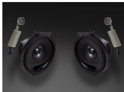
TF-J10M スピーカーパッケージ 134,200円 税込価格 取付費別 フロント専用 推奨取付時間:1.5H