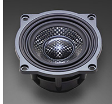
ハイグレードモデル

動作精度の徹底追求により、高密度で伸びやかな音質を実現。ナローギャップ・モーターシステム採用77mmワイドレンジドライバー。音楽の細部までしっかりと再現し、深みと広がりを感じられるモデルです。より鮮明で、音楽に没入できる体験を提供します。定評あるCMF(クロスマイクロファイバー)コーンや高精度アルミノブブロックフレーム、駆動系の動作精度を向上させてボイスコイルギャップを狭めたナローギャップ・モーターシステム、A.P.S.E.(エアプレッシャー・スムージングエッジ)などを採用したハイグレードタイプの77mmフルレンジユニット＝S-77M型を使用。これらにより理想とされるエンクロージャ化と点音源化を実現したことで、緻密でクリア、スケール感あふれる再生音をお楽しみいただけます。