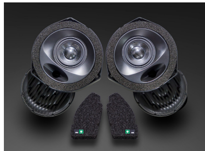
TF-A200M スピーカーパッケージ 227,700円 税込価格 取付費別 推奨取付時間：1H