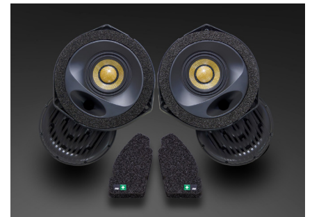
TF-A200F スピーカーパッケージ 385,000円 税込価格 取付費別 推奨取付時間：1H