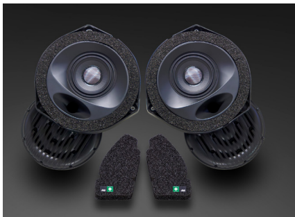
TF-A200E スピーカーパッケージ 118,800円 税込価格 取付費別 推奨取付時間：1H

新開発の77mmワイドレンジドライバー「S-77F」型を搭載。最上級プレミアムラインと同じ「HAC」(ハイブリッド・アラミド・カーボン)振動板をコーン部に、オールピュアアラミドのセンターキャップを贅沢に使用し、A.P.S.E.(エアプレッシャー・スムージングエッジ)技術を採用しました。ソニックデザイン独自のエンクロージャも深化。Gチューナーをバッフル部とバックチャンバー側周部に配置したことでポートとバックチャンバーの理想形状化を実現。「S-77F」型とのシナジーにより低域から高域まで可聴帯域のほとんどの高品質再生を可能としています。また、販売する製品へ確実に反映させるために、専用ラインでの厳密な組付けやペアマッチによる左右チャンネルの音合わせなどをおこない製品化されています。音楽が始まる瞬間から最後の余韻まで、音の一つひとつが空間に溶け込むような自然な響きを実現。ただ純粋に音楽の世界へと誘う、高品位な音質をお楽しみいただけます。