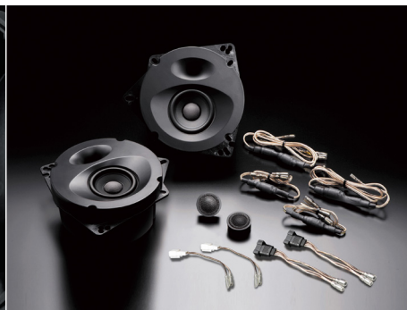
SP-R501E【ディスプレイオーディオ専用】