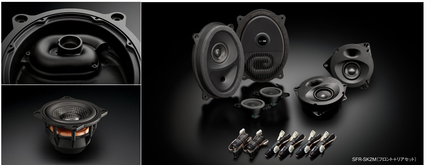
SFR-SK2M(フロント+リアセット)

82,500円(税抜価格75,000円) 取付費別 推奨取付時間:1.0H(リアのみ)