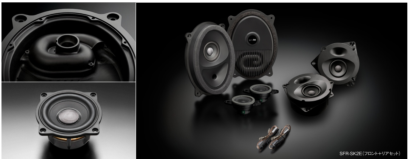
SFR-SK2E(フロント+リアセット)

この製品には、ソニックデザイン独自の音響解析・補正ノウハウを結集してオーディオシステムの再生環境を改善するAcoustic Control(アコースティックコントロール)技術を採用しています。