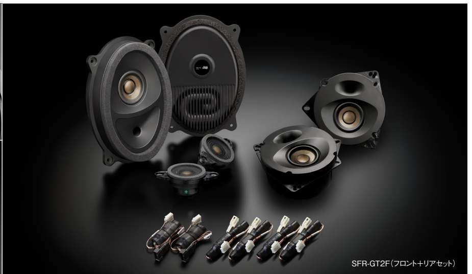
SFR-GT2F(フロント+リアセット)