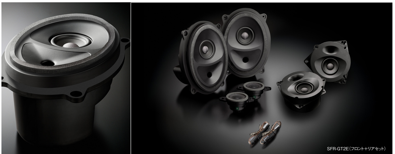
SFR-GT2E(フロント+リアセット)

この製品には、ソニックデザイン独自の音響解析・補正ノウハウを結集してオーディオシステムの再生環境を改善するAcoustic Control(アコースティックコントロール)技術を採用しています。