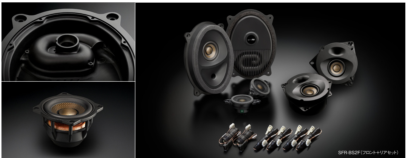
SFR-BS2F(フロント+リアセット)

SR-BS1F スピーカーパッケージ リア専用単品 148,500円(税抜価格135,000円) 取付費別 推奨取付時間:1.0H(リアのみ)