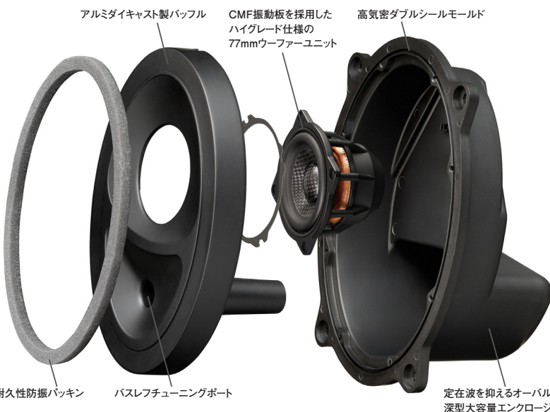
アルミダイキャスト製パッフル CMF振動板を採用した ハイグレード仕様の 77mmウーファーユニット 高気密ダブルシールモールド

この製品には、独自の音響解析・補正ノウハウを結集して再生環境を改善するAcoustic Control(アコースティックコントロール)技術を採用しています。