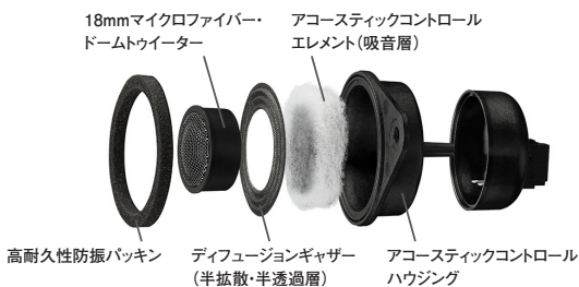
18mmマイクロファイバードームトウィーター アコースティックコントロール エレメント(吸音層)

クロスカーボン系CMF振動板、ナローギャップ・モーターシステムと高密度ネオジウムマグネットによる強力磁気回路採用の77mmウーファーユニット=SD-N77M型●ハイグレードモデル専用の音質チューニングを実施したアルミハイブリッドエンクロージャ(フロント:深型大容量オーバル形状、リア:丸形コンパクトタイプ)●有害な反射音を拡散・吸音し、スムーズで自然な高音再生を実現するアコースティックコントロール技術採用のACトウィーター(18mmマイクロファイバードームトウィーター=SD-T18型内蔵)●厳選した音響専用パーツによる外付けタイプのトップグレード仕様ハイパスローパス独立式ネットワーク●3年間の長期製品保証