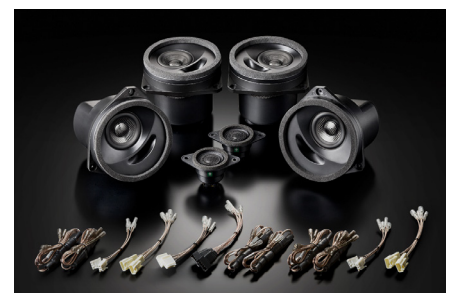
SFR-S01M(フロント+リアセット)

【製品に関するご注意】●本製品にはフロント専用単品のSF-S01Mと リア専用単品のSR-S01M、これらをセットにしたフロント+リアセットの SFR-S01Mの3製品を用意しております。本来の音質と性能をお楽し みいただくためにはフロント用とリア用の同時装着をお勧めします●本 製品をフロントのみに装着して純正リアスピーカーと併用する場合はリ アスピーカーの音量を絞って(調節して)お使いください。またリアのみの 装着は推奨していません●ソニックデザイン製品認定販売店では、本 製品の音質をさらに引き立てるグレードアッププランも各種用意してお ります。詳しくはお近くの認定販売店、または直接弊社へお訊ねください。