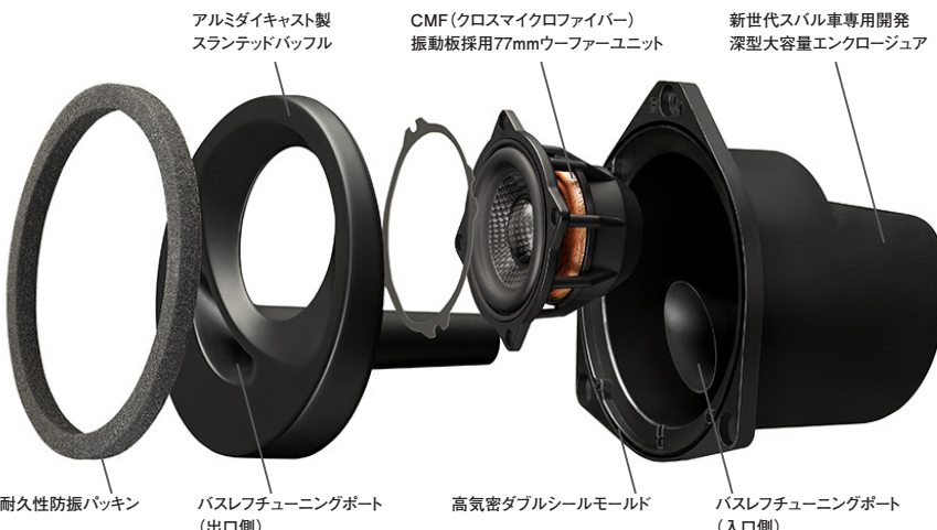
アルミダイキャスト製 スランテッドバッフル

この製品には、 独自の音響解 析・補正ノウ ハウを結集して 再生環境を改善するAcoustic Control(アコースティックコン トロール)技術を採用しています。