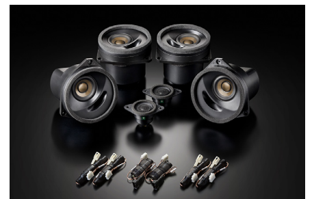
SFR-S01F(フロント+リアセット)

【製品に関するご注意】●本製品にはフロント専用単品のSF-S01Fとリア専用単品のSR-S01F、これらをセットにしたフロント+リアセットのSFR-S01Fの3製品を用意しております。本来の音質と性能をお楽しみいただくためにはフロント用とリア用の同時装着をお薦めします●本製品をフロントのみに装着して純正リアスピーカーと併用する場合はリアスピーカーの音量を絞って(調節して)お使いください。またリアのみの装着は推奨していません●ソニックデザイン製品認定販売店では、本製品の音質をさらに引き立てるグレードアッププランも各種用意しております。詳しくはお近くの認定販売店、または直接弊社へお訊ねください。