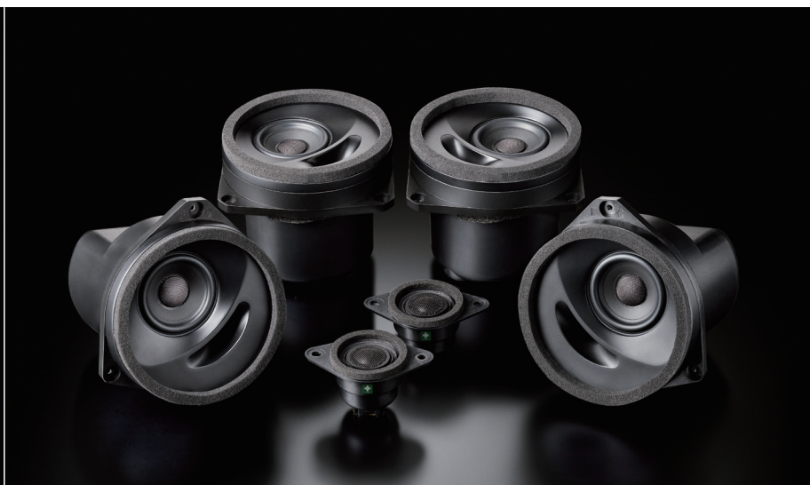
SFR-S01E(フロント+リアセット)