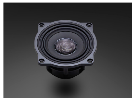
S-77E 77mmワイドレンジドライバー

*フェーダー等でお好みに合わせて調整ください。前後同グレード機種推奨 **原状復帰に伴う取り外しや再装着の際には別途装着工賃を申し受けます。