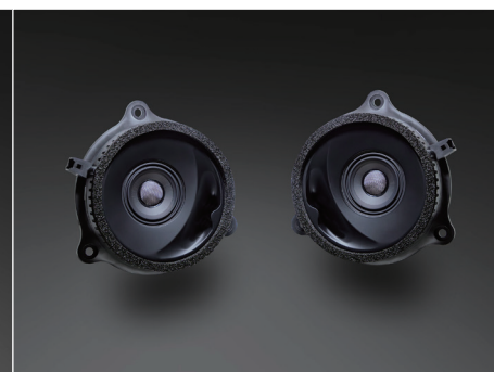
NF-E13E / NR-E13E