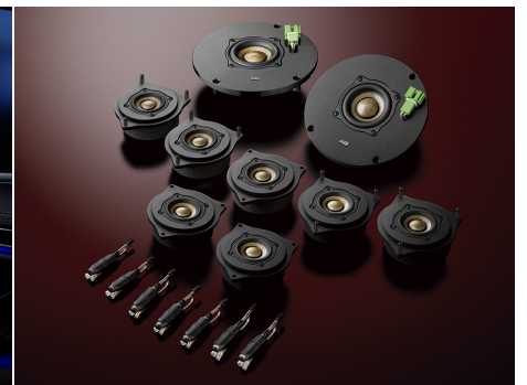
左:メルセデス・ベンツSクラスへの装着イメージ(画像は合成によるもので、スピーカーユニットは実際には見えません) 右:3C-222 Triple Crestを構成するスピーカーモジュール