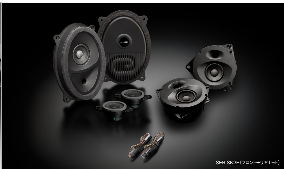
SFR-SK2E(フロント+リアセット)