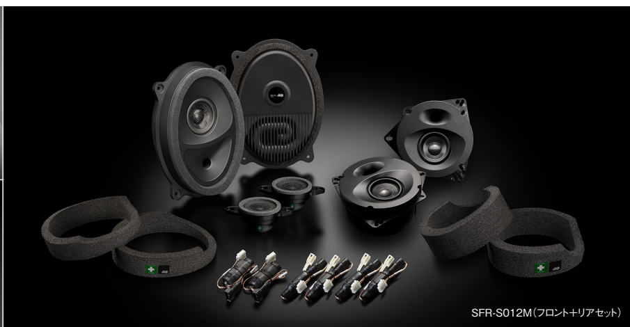
SFR-S012M(フロント+リアセット)