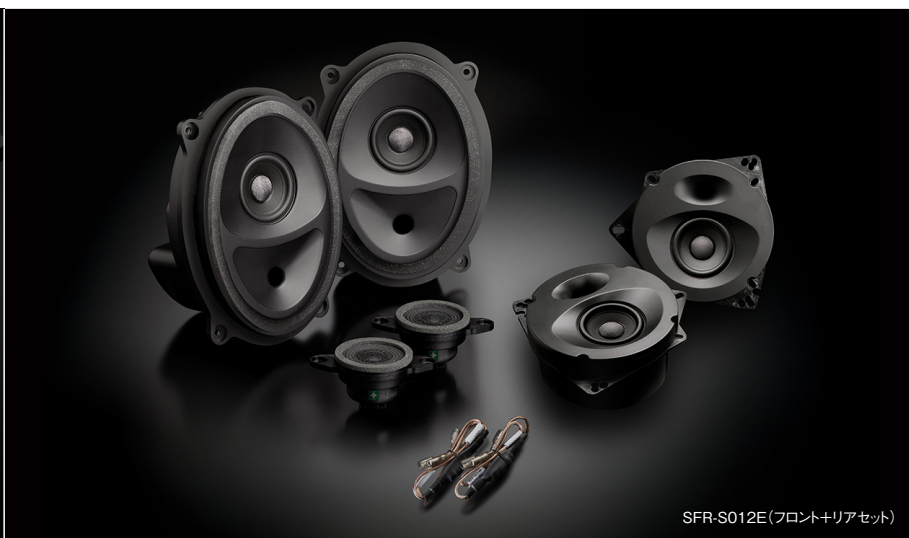
SFR-S012E(フロント+リアセット)