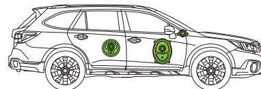
LEGACY OUTBACK (2014/H26-)