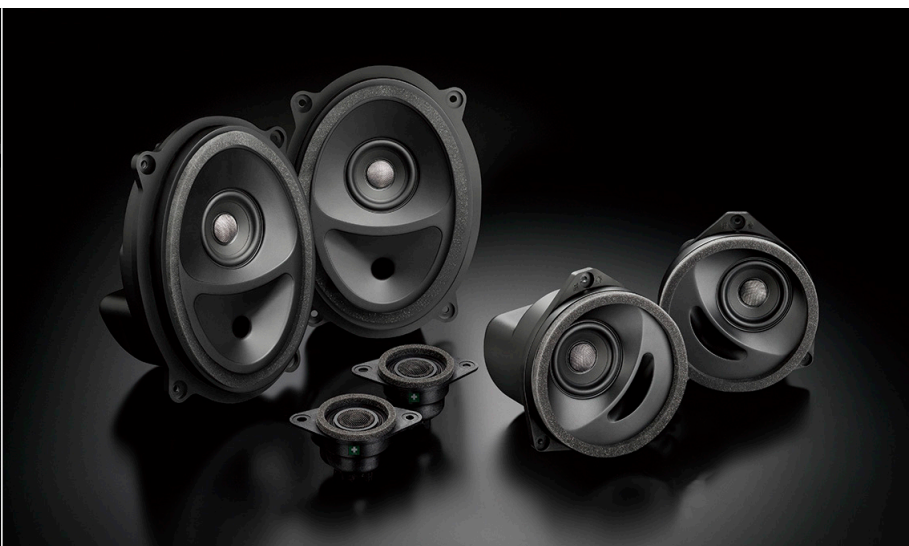
SFR-S03E(フロント+リアセット)