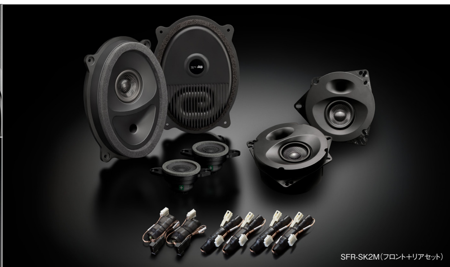
SFR-SK2M（フロント+リアセット）