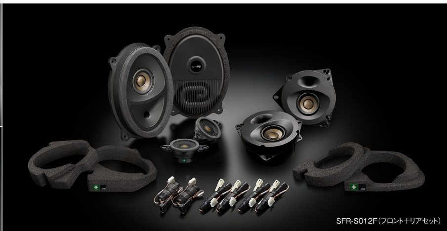
SFR-S012F(フロント+リアセット)