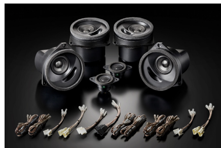
SFR-S01M(フロント+リアセット)

【製品に関するご注意】●本製品にはフロント専用単品のSF-S01Mとリア専用単品のSR-S01M、これらをセットにしたフロント+リアセットのSFR-S01Mの3製品を用意しております。本来の音質と性能をお楽しみいただくためにはフロント用とリア用の同時装着をお薦めします●本製品をフロントのみに装着して純正リアスピーカーと併用する場合はリアスピーカーの音量を絞って(調節して)お使いください。またリアのみの装着は推奨しておりません●ソニックデザイン製品認定販売店では、本製品の音質をさらに引き立てるグレードアッププランも各種用意しております。詳しくはお近くの認定販売店、または直接弊社へお訊ねください。