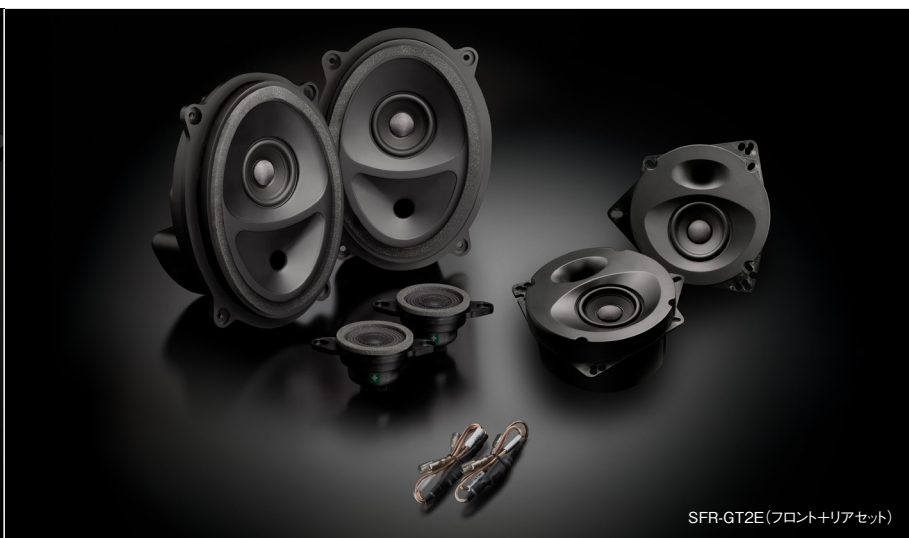
SFR-GT2E(フロント+リアセット)