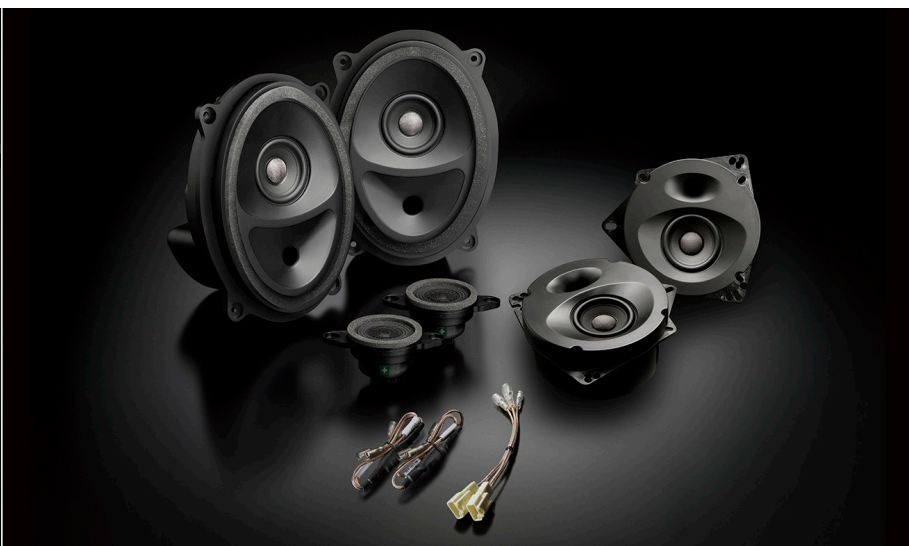
SFR-S02E (フロント+リアセット)