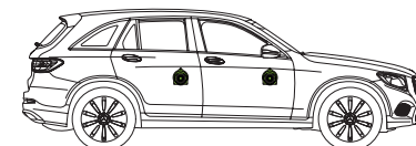
GLC(X253/2016-) & GLC Coupe(C253/2017-)

●上記車種(正規輸入車)に対応。ただし純正Burmester®サラウンドサウンドシステム装着車には取り付けできません。本製品はフロント+リアセットです。*イラスト上のスピーカー装着位置と縮尺比は実際と異なります。