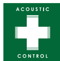
「アコースティックコントロール」 テクノロジーロゴマーク

「アコースティックコントロール」とは、これまで弊社が培ってきた音響解析・補正ノウハウによってオーディオシステムの再生環境を向上し、システム本来のポテンシャルを引き出して、より良い音を実現するためのテクノロジー&コンセプトの総称です