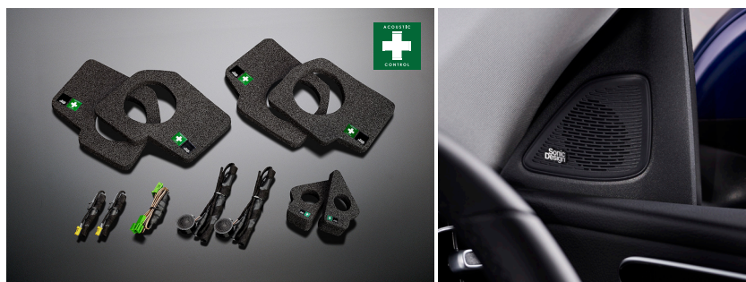
左:「Sonic Design Sound Suite」新型Cクラス専用モデル セット内容 右:付属のSonic Designエンブレムの純正トゥイーターへの装着例