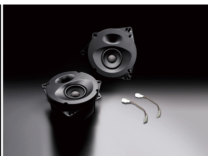
「SP-R50RE」(スタンダードモデル、リア専用)