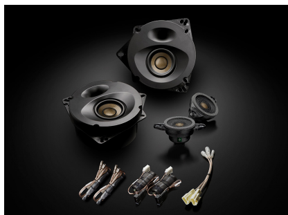
「SP-R50F」(トップグレードモデル、フロント専用)