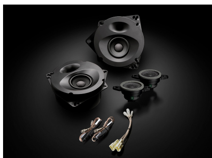
「SP-R50E」(スタンダードモデル、フロント専用)