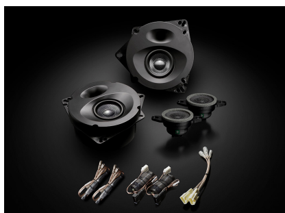
「SP-R50M」(ハイグレードモデル、フロント専用)