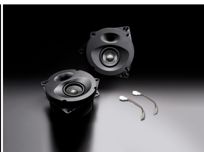
「SP-R50RM」(ハイグレードモデル、リア専用)