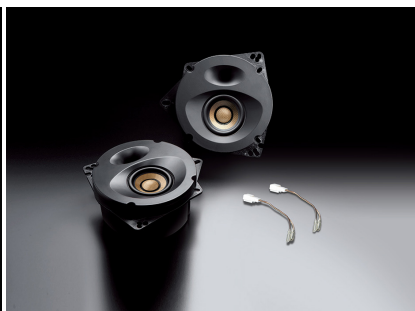
「SP-R50RF」(トップグレードモデル、リア専用)