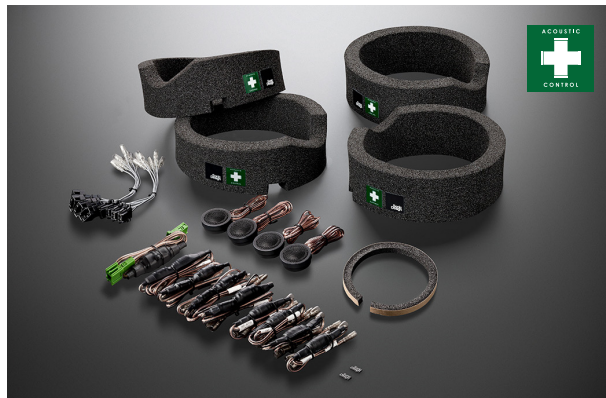
「Sonic Design Sound Suite」新型CLA専用モデル セット内容