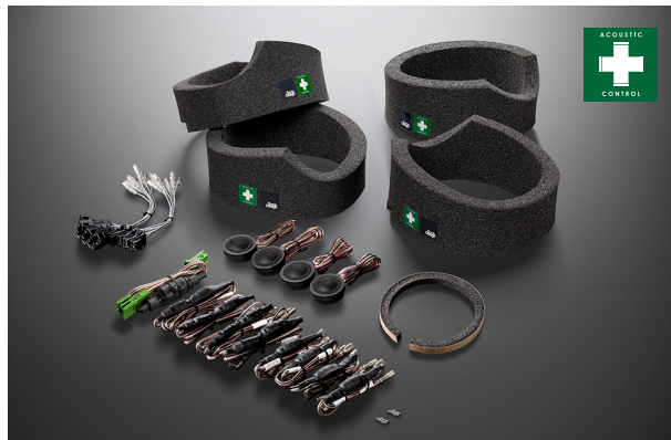
「Sonic Design Sound Suite」新型 Bクラス専用モデル セット内容