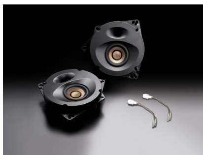
スピーカーパッケージ「SP-Y11F」 (フロント専用フルレンジタイプ)