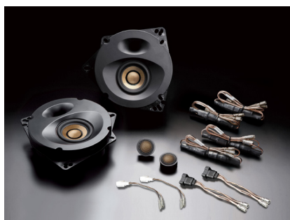
スピーカーパッケージ「SP-Y12F」 (フロント専用セパレート2ウェイタイプ) ※ネットワーク付属