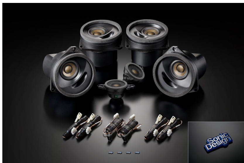
SonicPLUS SUBARU「SFR-S01Fi」と限定カラー(青)の専用オーナメントバッジ