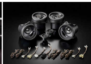
「SFR-S01M」ハイグレードモデル