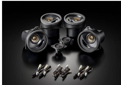
「SFR-S01F」トップグレードモデル