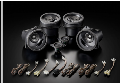
「SFR-S01M」ハイグレードモデル