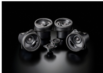
「SFR-S01E」スタンダードモデル