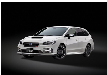
スバル レヴォーグ

※デモカーは1店舗につき1台となります。試聴製品は店舗により異なります。(次ページ参照)