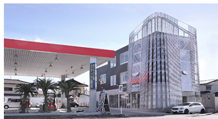
ソニックプラスセンターいわき

http://www.sonic-design.co.jp/sonicplus-center/