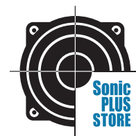
ソニックプラスストアロゴ