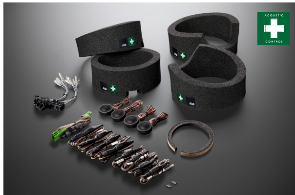
「Sonic Design Sound Suite」新型Aクラス専用モデル セット内容