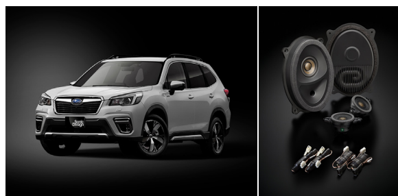
試聴デモカー一例:スバル フォレスター