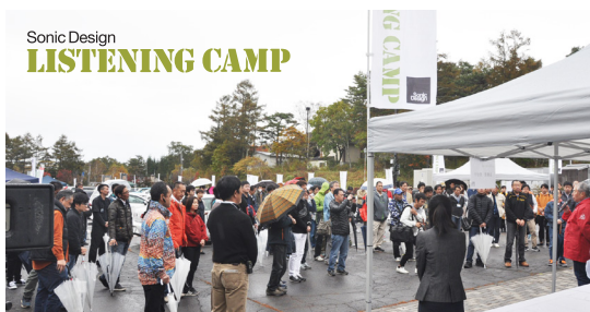
昨年開催された「リスニングキャンプ9」(女神湖/長野県)の様子

*運営の都合上、場内イベントの一部にはスケジュールを設定しているものがあります。