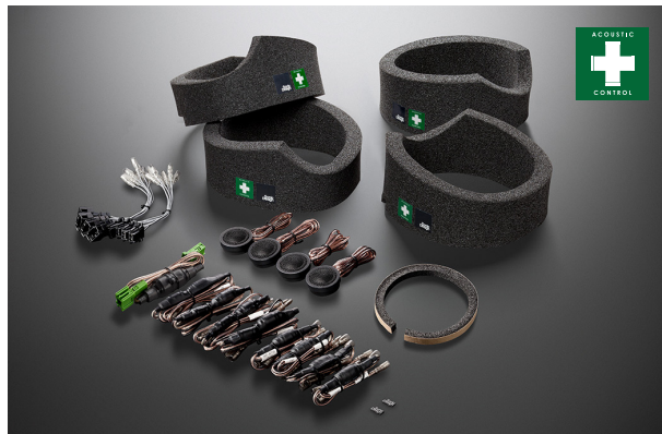
「Sonic Design Sound Suite」新型EQB専用モデル セット内容