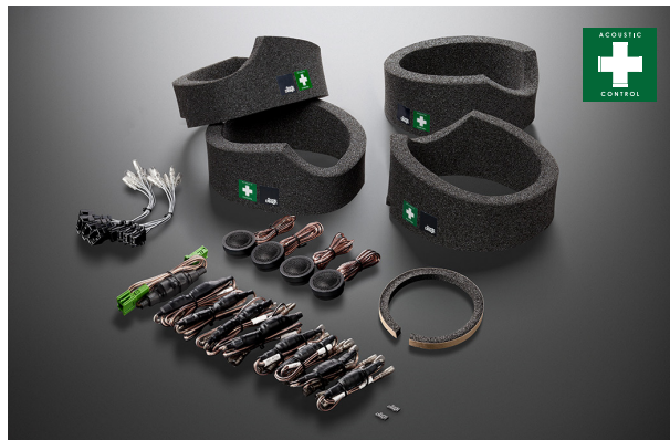
「Sonic Design Sound Suite」新型EQA専用モデル セット内容