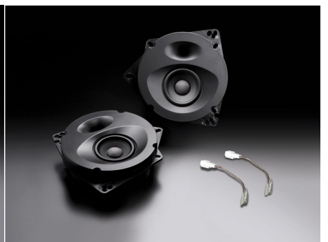
SP-ES81E (フロント/リア両用)