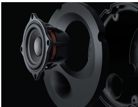
エンクロージャ一体型モジュール

SP-ES81E スピーカーパッケージ 本体価格35,000円(セット)+税 取付費別 フロント/リア両用 推奨取付時間: フロント1H/リア2.5H