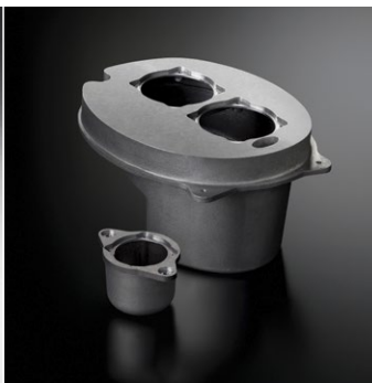
ソノキャスト ARMS エンクロージャ