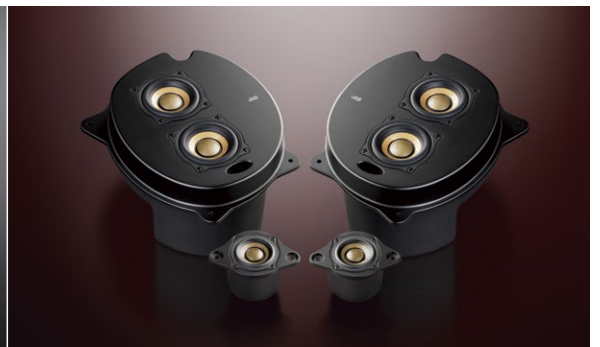
3C-P30L Triple Crest