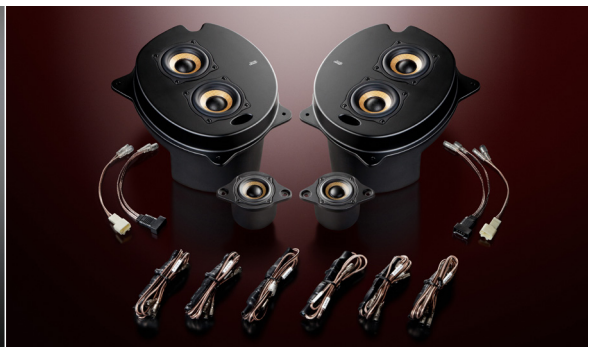
2C-P30 Double Crest (ネットワーク付属)