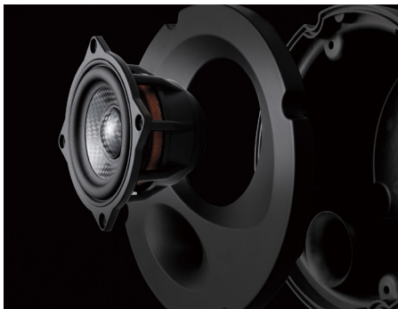
エンクロージャ一体型ウーファーモジュール

SP-211RM スピーカーパッケージ(リア用) 本体価格133,000円(セット) + 税 取付費別 推奨取付時間: 3H(フロントのみ)、6H(フロント+リア)